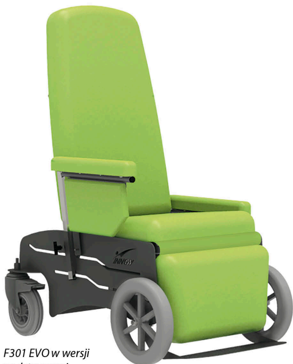
F301 EVO w wersji podstawowej

F301H EVO z następującym wyposażeniem opcjonalnym: pasy bezpieczeństwa 5-punktowe, podglówek z regulacją wysokości, podnóżek demontowalny (CROSS)