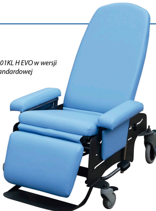
F301KL H EVO w wersji standardowej

Modele F301KL EVO i F301KL H EVO wyposażone są w zwrotne koła , co umożliwi swobodne przemieszczanie w wąskich przejściach i ciasnych pomieszczeniach.